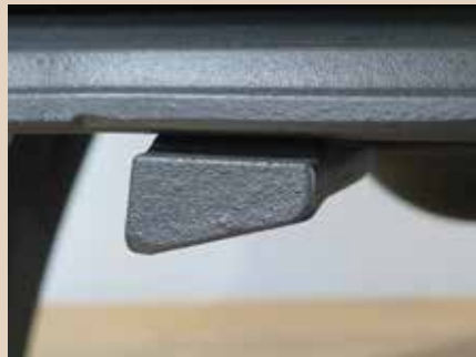
Manette unique de réglages d'air de combustion

Un poêle à bois au design classique avec porte latérale de chargement.