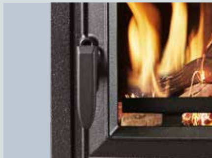
Poignée de porte