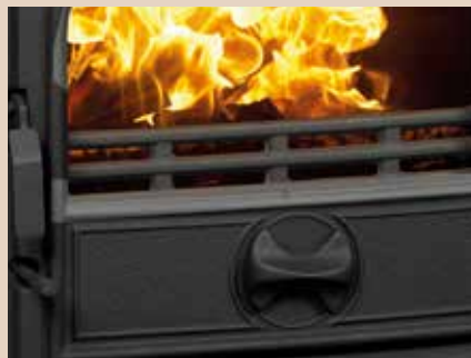
Disque de réglages d'air de combustion