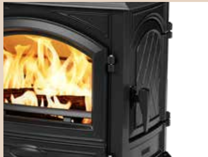
Porte latérale de chargement