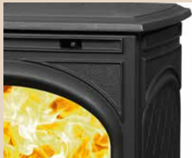
Détail « 425GM »