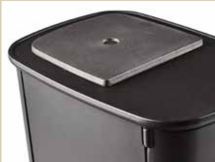
Plaque de cuisson en option*